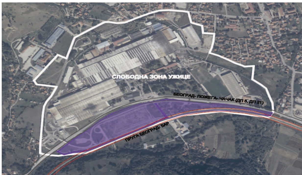
Слика 3. Једна од расположивих локација у оквиру Слободне зоне (означена бојом)

Слободна зона Ужице. Као резултат ЈПП града Ужица са Ваљаоницом бакра АД Севојно и компанијом Импол Севал АД, 2010. године формирана је Слободна зона Ужице, једна од 13 у Србији, у индустријској зони Севојно Л , поред државног пута Ужице-Београд.