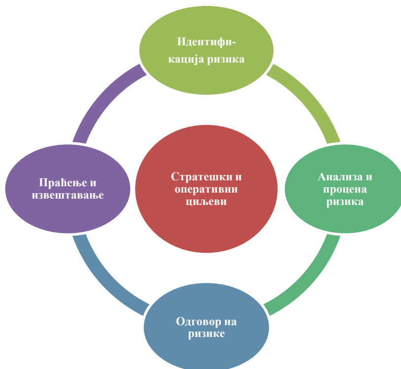
Слика 1. Процес управљања ризицима

Процес управљања ризицима састоји из четири основна корака која се примењују и на стратешке и на оперативне ризике: 1) идентификација ризика; 2) анализа и процена ризика; 3) одговор на ризике; и 4) праћење и извештавање.